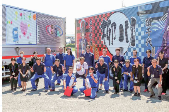
私たちが求めているのは、人としての魅力を備えた方です。私たちと一緒に柳川合同グループを盛り上げていきましょう!